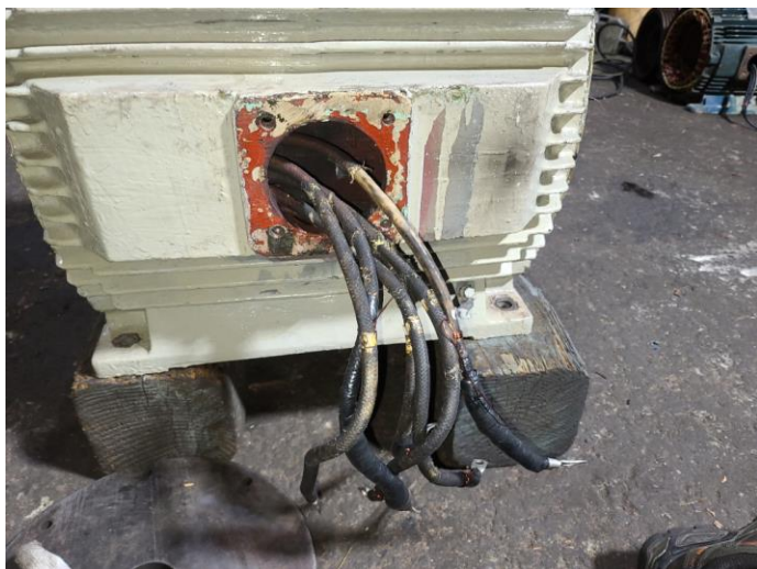
POWER LINE SILICONE TUBE로 보강시 양호 사용 가