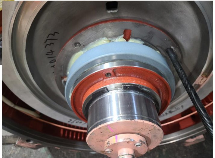
반 부하 외륜 coating 됨