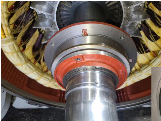
부하 내륜 coating 됨