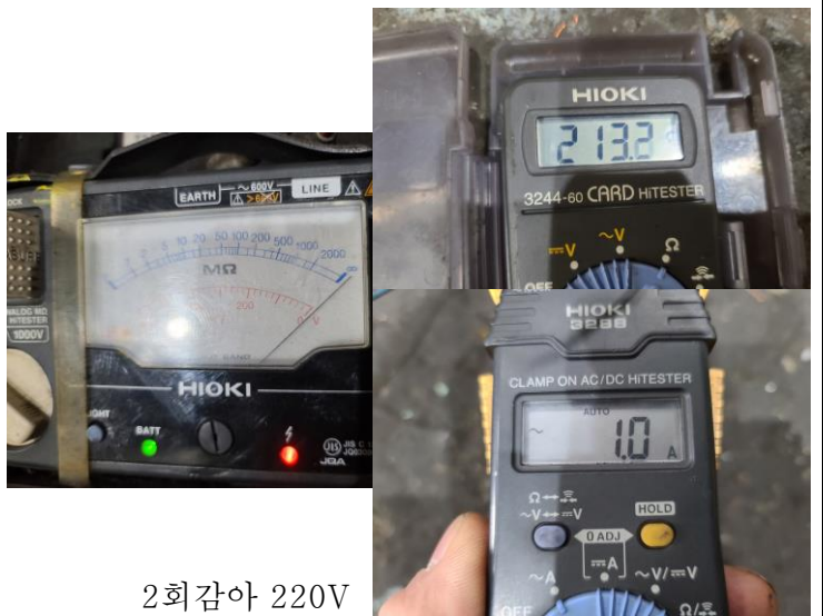
2회감아 220V 실 CURRENT는 0.45A