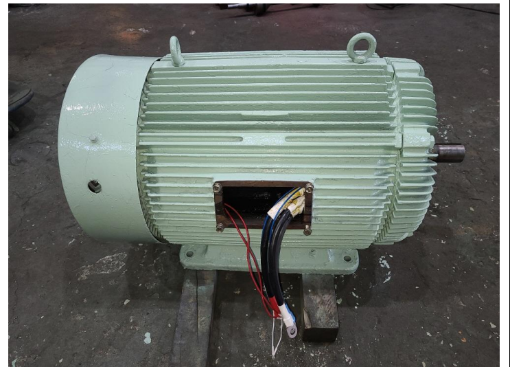
출고 검사 후